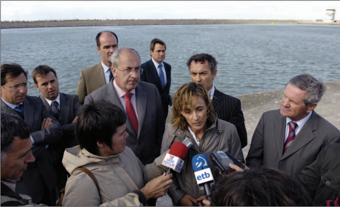
Autoridades vascas y flamencas en el Puerto de Zeebrugge.

La Consejera de Transportes y Obras Públicas del Gobierno Vasco, junto al Director de Asuntos Europeos del Gobierno Vasco y Delegado de Euskadi en Bruselas, así como representantes de las autoridades portuarias de Bilbao y Pasajes se reunieron el pasado 11 de Septiembre con las autoridades portuarias de Zeebrugge. El encuentro se realizó en el marco de la inminente puesta en marcha de la "autopista del mar" Zeebrugge-Bilbao