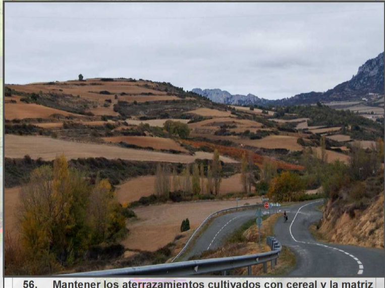
56. Mantener los aterrazamientos cultivados con cereal y la matriz natural en los taludes