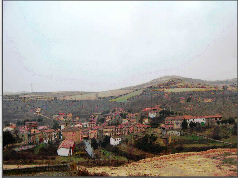
29. Núcleo compacto de Barriobusto