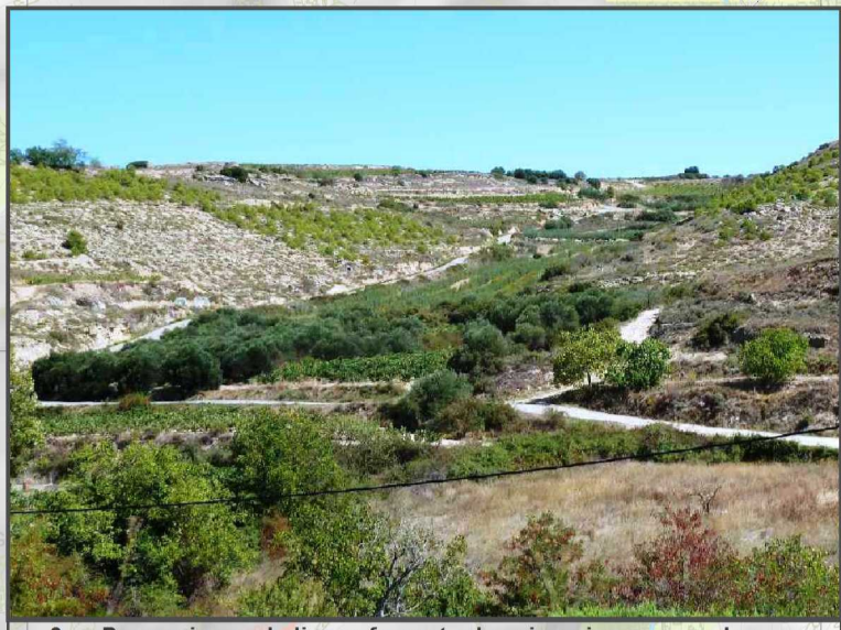
3. Promocionar el olivar y fomentar las sinergias que puedan darse entre esta actividad y la calidad paisajística