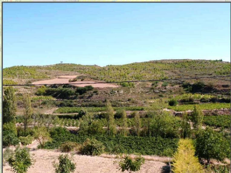
28. Preservar el mosaico de cultivos y fomentar la presencia de árboles frutales