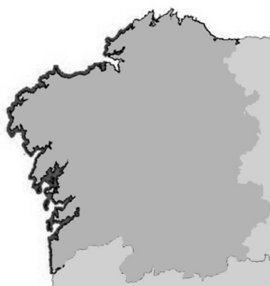
Área afectada por la prohibición de marisqueo