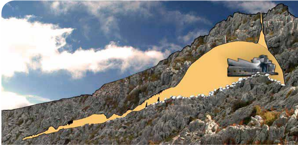
Reconstrucción del tamaño de la torca.