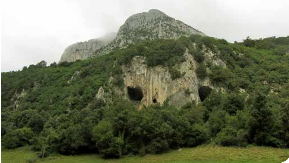
Macizo calcáreo de los montes de Ranero donde se sitúa la gran Torca del Carlista.