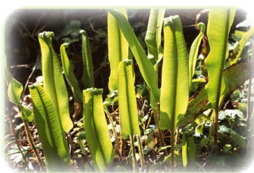
FIGURA ETA NEURRI BABESLEAK

garaitik gaur arte, eta horren aztarna ugari ditugu: trenbideak, galeriak eta eraikuntzak. Higadura-prozesuek forma desberdinetako espazio bat konfiguratu dute, aldapa arrokatsu gogorrekin, baso naturalekin eta larre-eremu leunekin. Enklabe horretako fauna basokoa da batez ere, baina badira ur-inguruneei loturikoak ere: besteak beste izokina, igaraba edo arriskuan dagoen bisoi europarra, parkeko erretan eta erreka ugarietan aterpea aurkitzen dutenak.