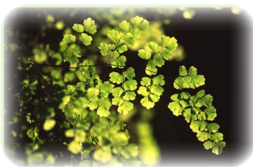
FIGURA ETA NEURRI BABESLEAK

tzalea, uren kalitate ona adierazten du. Ibaiak igarotzen duen malda handia tradizionalki presak, erretenak eta burdinola txikiak instalatzeko aprobetxatu da. Haranaren erdi-erditik igarotzen zen Nafarroarako antzinako trenbidea burdinbide berde bilakatu da eta hor enklabe horren balio ekologiko handiaz gozatzeko aukera eskaintzen zaigu.