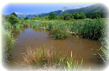
FIGURA ETA NEURRI BABESLEAK

ur-lasterrak. Fauna ere aberatsa da oso: martin arrantzalea, basurdea, arrano txikia, sai zuria, aztore arrunta, muxar grisa, lephoria, basakatua, igaraba, etab.; halerre, 6oko hamarkadan berriz ekarritako oreinak dira gune honetako protagonista nagusiak. Duen aberastasun naturalaz gain, Gorbeia leku sinbolikoa da bertako elezahar eta tradizioengatik, bai eta euskal mendizaletasunaren erreferentzia-puntu gisa ere.