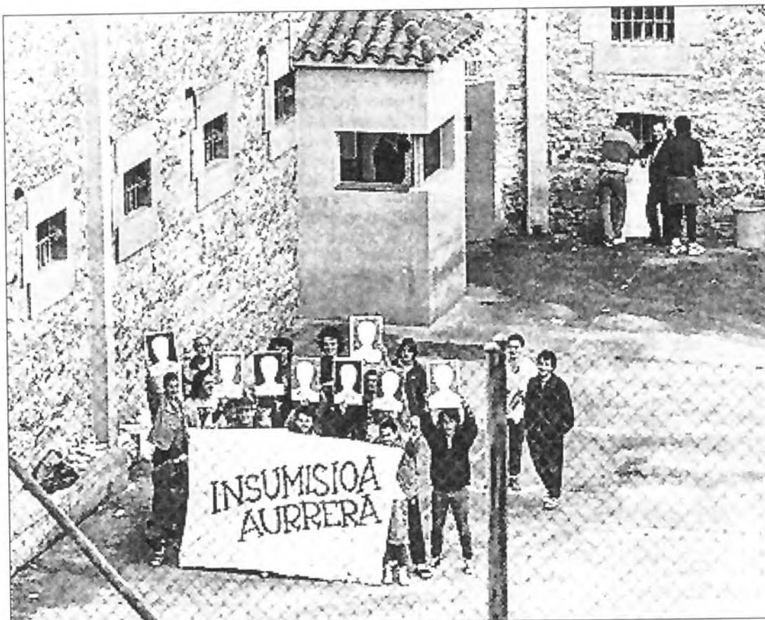
Intsumisoak Iruñeko kartzelan.

Espainiako gazte guztiak egin behar dute soldadutza edo horren ordezkoko Zerbitzu Soziala.