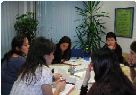
Lan-jardunaldia Kontsumo Geletan

Kontsumo Prestakuntzako bi Zentro horien errealitatea eta trukeen nahiz etorkizunerako proposamenen deskribapena Escola de Consum eta Kontsumo Gelak zentroen artean egindako argitalpen batean bilduko dira.