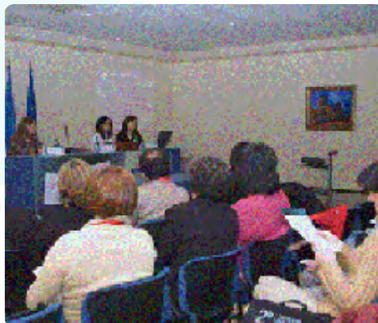
Kontsumitzailearen Prestakuntza Zentroen II. Estatu Topaketako ponentzia

Oso aberasgarria izan zen gainerako Autonomia Erkidegoekin esperientziak trukatzea eta azaltzea; izan ere, foro bat osatu zen bertan eta kontsumoa lantzeko hainbat modu berri aztertu zen, baita horiei buruz eztabaidatu ere, gizarte-sarea osatzen duten kolektibo guztiak kontuan izanik.