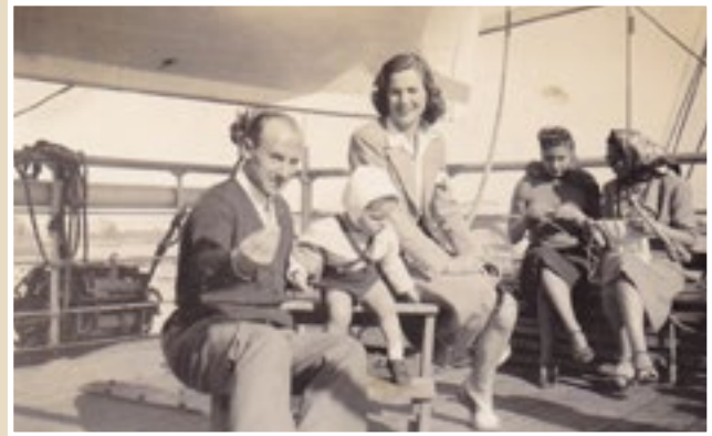
19. Euskal errefuxiatuak Nyassan (1942).