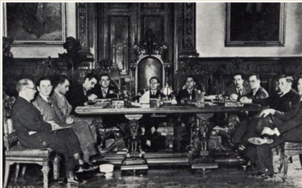
6. Eusko Jaurlaritzaren kontseilua, Bizkaiko Foru Aldundian (1936). La Sanidad Militar en Euzkadi, 1937.