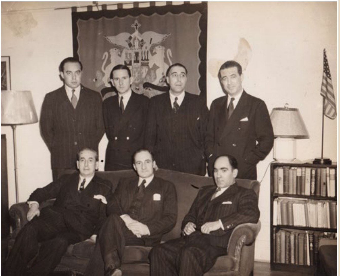
25. Eusko Jaurlaritzaren bilera, New Yorkeko ordezkartzan (1945).