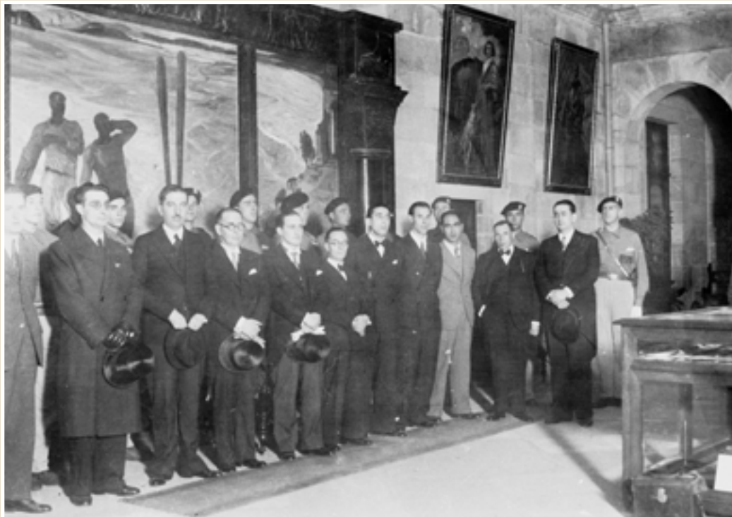
5. Eusko Jaurlaritza agindua hartzen Gernikan (1936). Bidasoa funtsa, Euskadiko Artxibo Historikoa.