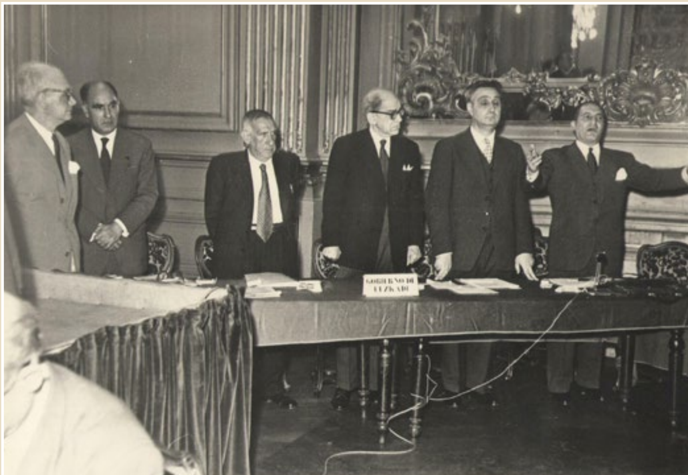
28. Eusko Jaurlaritza Munduko Euskal Kongresuan 1956. Aznar familiaren artxiboa.