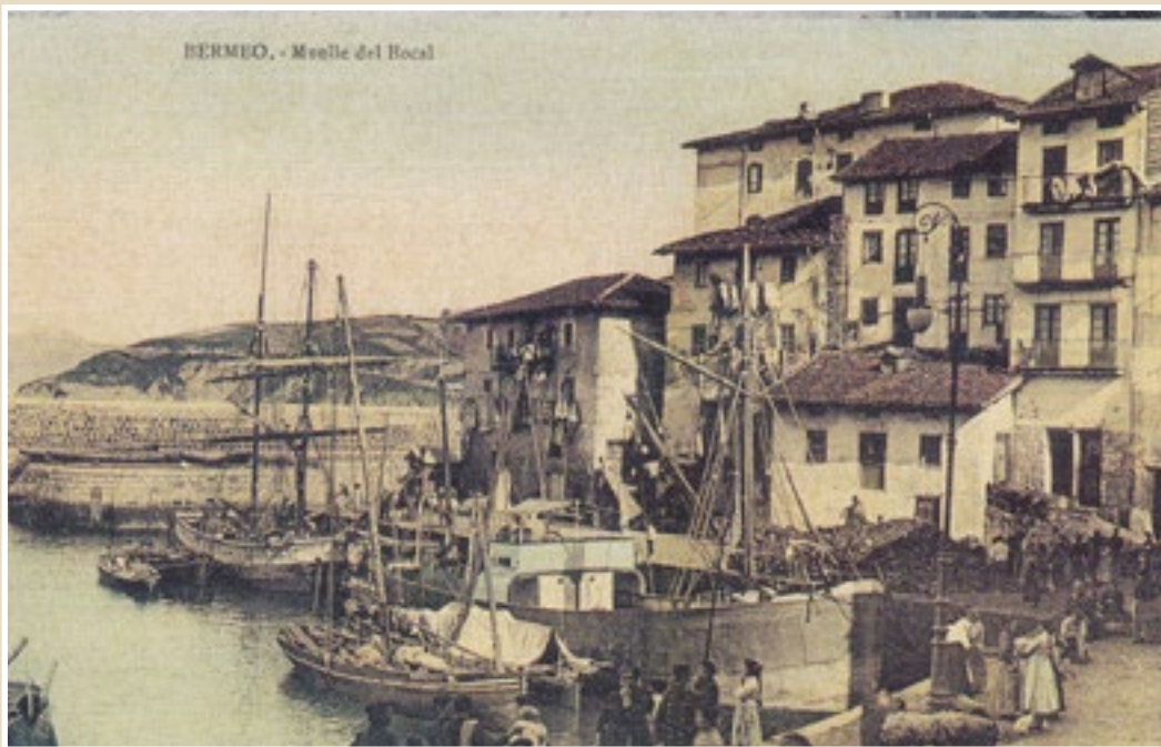
2. Bermeoko kaia, eta, erdian, familiaren konpainiako baporeetako bat. Nardiz familiaren artxiboa.