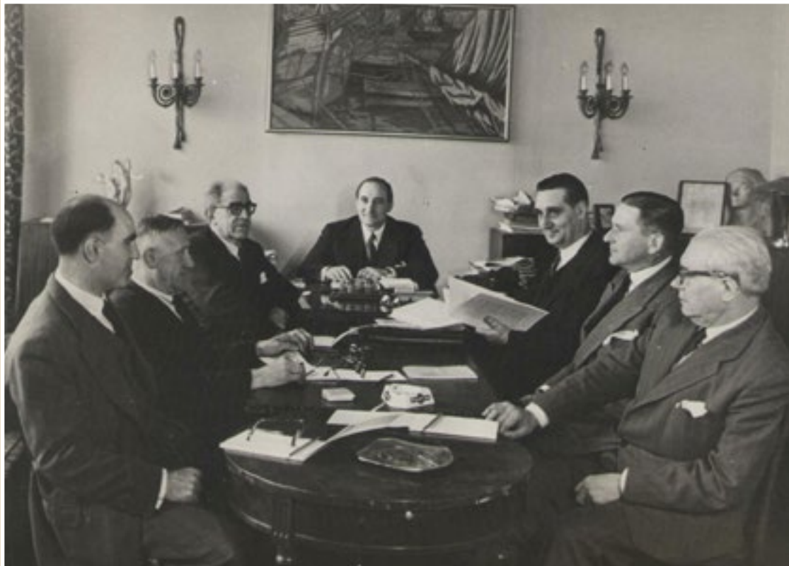
26. Eusko Jauriaritzaren bilera, Parisen (1952).