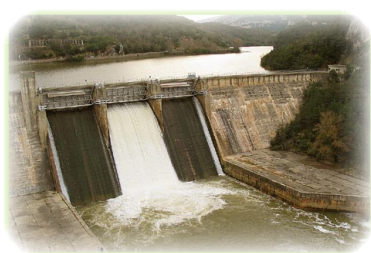
FIGURAS Y MEDIDAS DE PROTECCIÓN

de Álava. Este abrupto paraje, tapizado por extensos y variados bosques, es uno de los lugares de primordial interés faunístico de la Comunidad Autónoma del País Vasco, siendo especialmente valioso como área de cría de aves rupícolas.