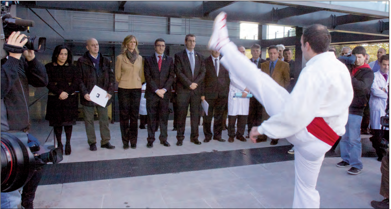
Aurresku de honor ante las autoridades y directivos del Hospital y Biodonostia.

marcha del instituto "es el resultado del compromiso de las organizaciones que conforman Biodonostia y de la apuesta decidida que los Gobiernos de Euskadi y de España han hecho por la I+D+i y por la investigación sanitaria".