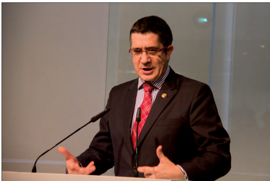
El Lehendakari en un momento de su intervención.

La Ministra de Ciencia e Innovación, Cristina Garmendia, destacó que la puesta en