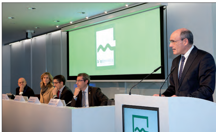
Palabras del Consejero de Sanidad