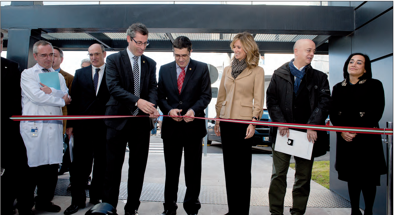
El Lehendakari López corta la cinta en la inauguración del nuevo centro.

Patxi López lehendakaria Euskadiko osasun arloko lehenengo ikerketa-institutuaren inaugurazio-ekitaldiaren buru izan zen joan den azaroan, bere ondoan Cristina Garmendia, Zientzia eta Berrikuntzako ministroa, egon zela. Lehendakariak esan zuen ekitaldian institutua sortu dela “modu azkar eta efikazean” lana aurrerakuntza zientifiko haute-mangarri bihurtzeko, gaixotasunen prebentzio, diagnostiko eta tratamendurako. Eta, gainera, aberastasun-iturri izan behar du “produktuak sortuz”. Bost urteko lana eta 14 milioi euro inbertitu dira institutuaren sorreran.