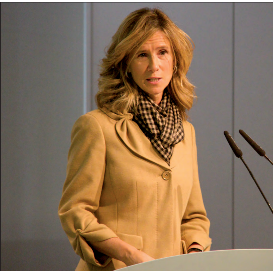
Intervención de la Ministra Garmendia

Finalmente intervino el Lehendakari Patxi López, quien se refirió a la labor investigadora del instituto como "Una investigación que busca acelerar al máximo el traslado de los conocimientos científicos a la práctica clínica, permitiendo un cuidado más eficaz de los pacientes". Recordó asimismo que los enfermos crónicos suponen hoy el 80% de las "actuaciones" sanitarias del Gobierno Vasco, de ahí que