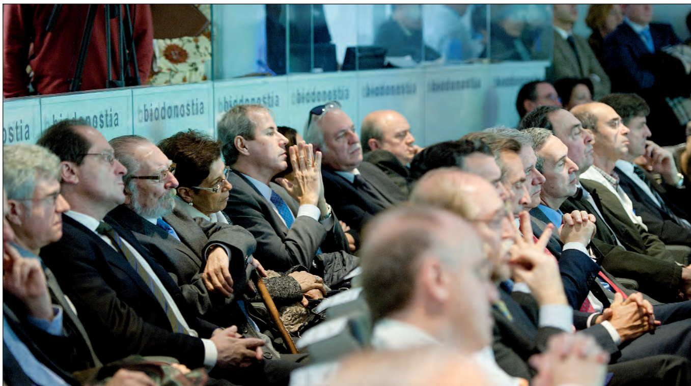
El acto inaugural fue seguido por numeroso público.