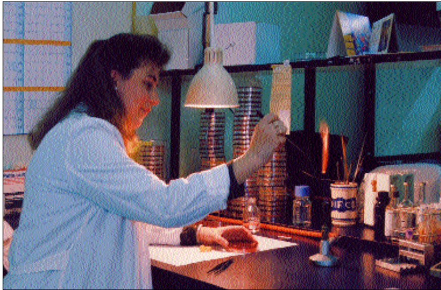
El Laboratorio Unificado Donostia

El Laboratorio Unificado se crea sobre la base de seis laboratorios de origen y se plantea, además de atender a la demanda ya existente, buscar nuevos mercados; mejorar la utilización de los recursos humanos, económicos y tecnológicos, generando avan-