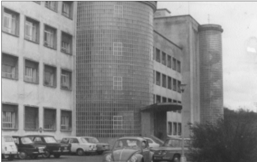
Hospital de Gipuzkoa. Años 60

sos, fue cedido al estado –Patronato Nacional de Lucha Antituberculosa– creándose el Hospital de Enfermedades del Tórax, que comenzó su actividad en el