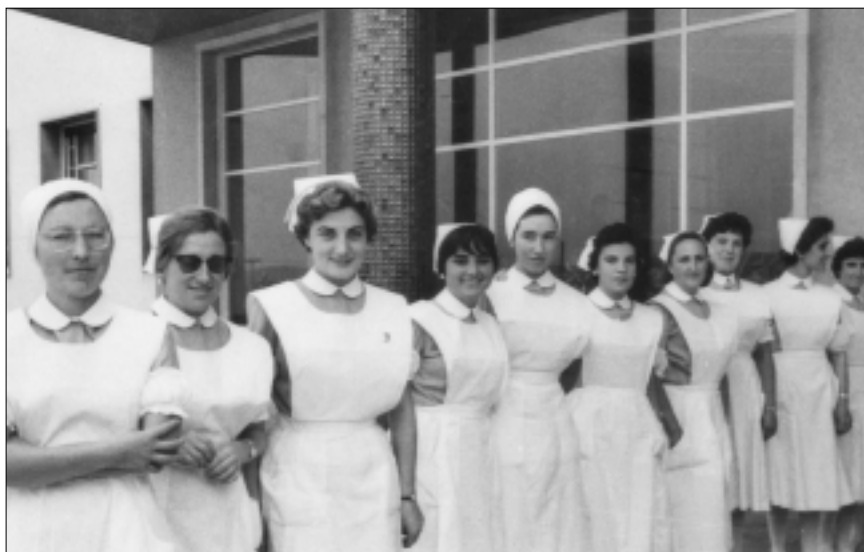
En la parte superior, enfermeras en la puerta de la Residencia Sanitaria el día de la inauguración.

En 1985, EL HOSPITAL DE GIPUZKOA, antiguo Hospital Provincial, pasa a integrarse en la red de Hospitales de Osakidetza como centro de agudos, atendiendo a una comarca sanitaria formada por 15 municipios y una población de 160.000 habitantes.