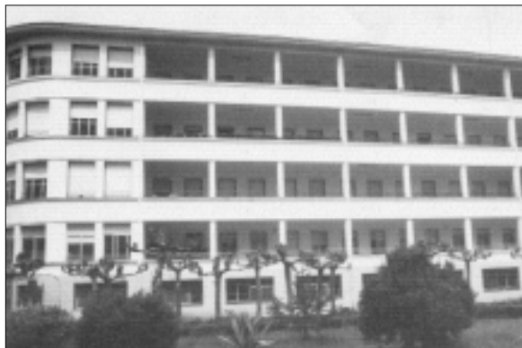
En la inferior, una vista del Hospital de Enfermedades del Tórax, en sus primeros años de funcionamiento.