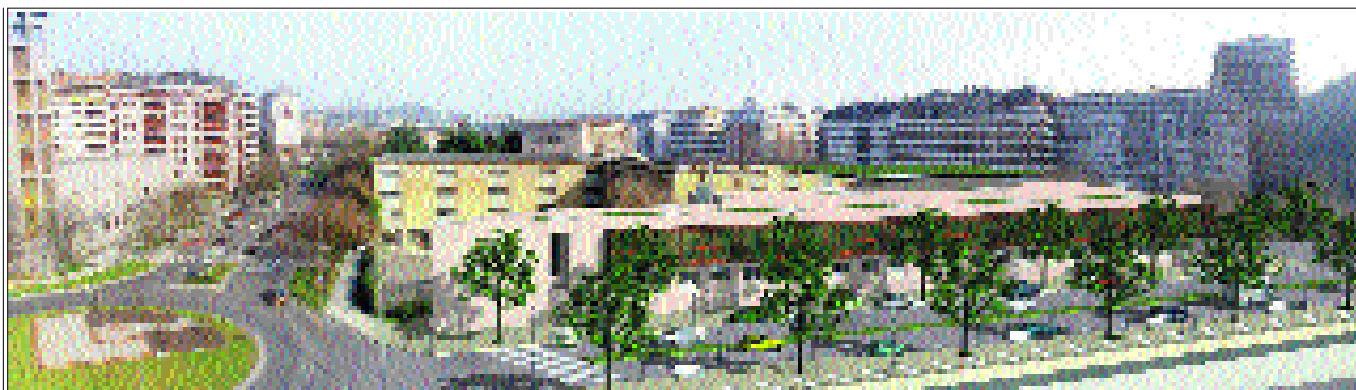
Fotomontaje del futuro Ambulatorio de Amara

gico ocupa la planta primera con siete quirófanos, cinco de los cuales para cirugía programada, uno de cirugía urgente y otro de radiología intervencionista.