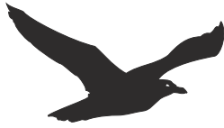
Tabla 3. Evolución de parejas nidificantes de Gaviota patiamarilla en Urdaibai.