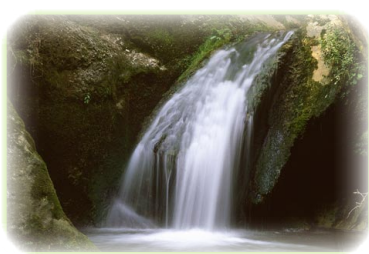
FIGURA ETA NEURRI BABESLEAK

jarraitzen diete landaguneetan. Hauetako bik nekazari-exodoaren aurrean amore eman zuten eta gaur egun hutsik daude. Espazio honetan biltzen diren inguruneen dibertsitateak bertako flora eta fauna aberatsa eragiten du, eta Euskal Herriko putre-kolonia garrantzitsuen nabarmentzen da.