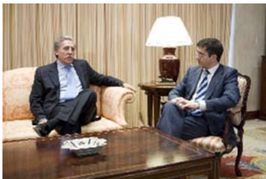
El Lehendakari saluda al Secretario de Estado de Asuntos Europeos (JB)

El Lehendakari mostró la voluntad de Euskadi de acoger importantes encuentros y eventos y confirmó la celebración de una Conferencia de Ciencia y Pobreza en San Sebastián en el mes de abril del 2010 y la Conferencia de Expertos de los 27 estados miembros para el lanzamiento de las Comunidades del Conocimiento y la Innovación en Bilbao .