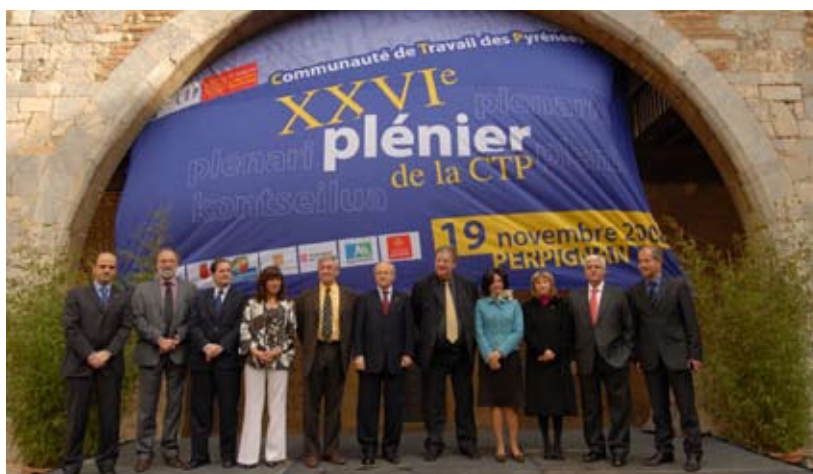
Consejo Plenario de la Comunidad de Trabajo de los Pirineos

El pasado 19 de noviembre, en el Palacio de los Reyes de Mallorca de Perpiñán, tuvo lugar el XXVIº Consejo Plenario de la Comunidad de Trabajo de los Pirineos (CTP), cuyos miembros son las Regiones de Aquitania, Midi-Pyrénées y Languedoc-Roussillon, quien ejerce la presidencia actualmente por un periodo de dos años; las Comunidades Autónomas de Catalunya, Aragón, Navarra y Euskadi; y el Principado de Andorra. El objetivo era presentar el balance de actividades del primer año de presidencia languedociana.