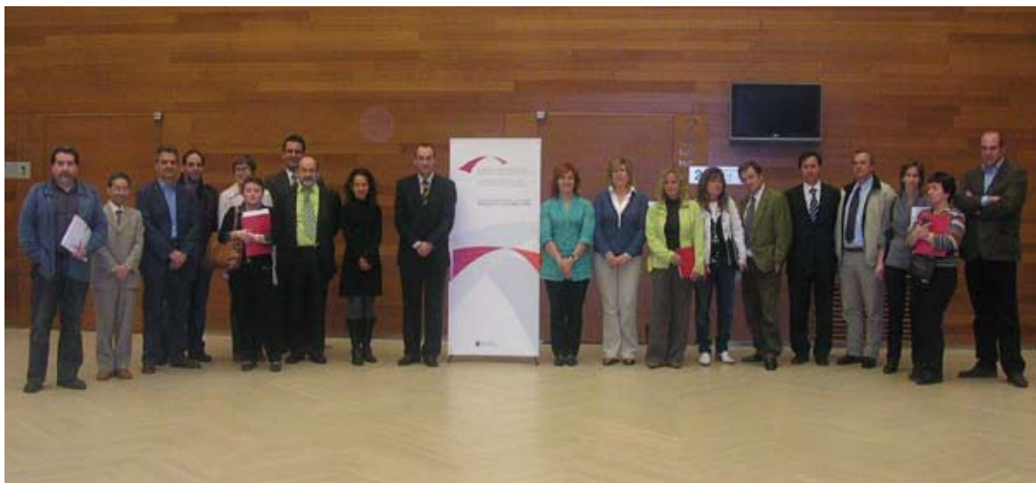
Organizadores, ponentes y asistentes a la jornada

La Diputación Foral de Gipuzkoa, a través de su Dirección General de Relaciones Externas y Turismo, organizó la jornada: "I. Jornadas técnicas sobre hermanamiento de ciudades", los días 22 y 23 de mayo en el palacio Kursaal de Donostia-San Sebastián.