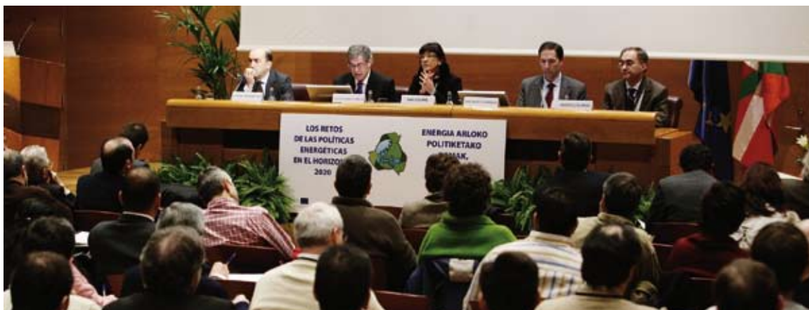
Sala de Palacio Euskalduna donde se celebró la jornada

EUROBASK y el EVE, con la colaboración del Departamento de Industria, Comercio y Turismo del Gobierno Vasco organizaron una jornada el pasado 28 de enero bajo el título: “Los retos de las políticas energéticas en el horizonte 2020”.