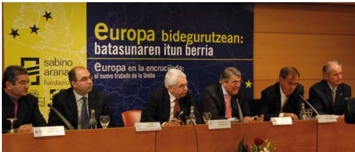
Diferentes personalidades que intervinieron en la jornada

El Lehendakari, Juan José Ibarretxe, y el presidente de la Generalitat de Catalunya entre 2003 y 2006, Pasquall Maragall, coincidieron el pasado 20 de noviembre en Bilbao en unas jornadas sobre el nuevo Tratado de la Unión Europea, organizadas por Sabino Arana Fundazioa.