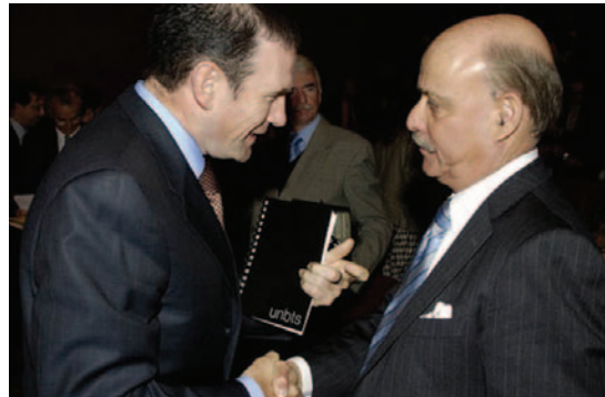
El Lehendakari Juan José Ibarretxe con Jeremy Rifkin.

La Secretaría General de Acción Exterior de la Presidencia del Gobierno Vasco con la colaboración de la Comisión Europea y de la Red Vasca de Información Europea, REVIE , celebró la jornada “ El papel de los medios de comunicación en la construcción de Europa ”, el día 31 de mayo en el Museo Guggenheim Bilbao.