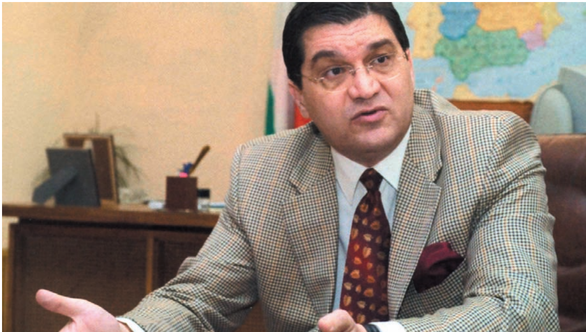
D. Vassiliy Takev, Embajador de Bulgaria

Entrevista con el Exmo. Embajador de Bulgaria, D. Vassiliy Takev