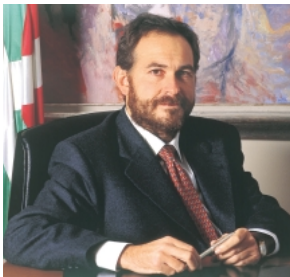
D. José Ignacio Zudaire.

El Viceconsejero de Innovación y Energía del Gobierno Vasco nos explica cuáles son los objetivos energéticos de Euskadi para el año 2010. En este sentido, cabe destacar actuaciones a favor de la eficiencia energética, la apuesta por las energías renovables, la contribución para cumplir con los objetivos de Kioto, y la sustitución del petróleo por la potenciación de la utilización de los recursos renovables y las energías limpias, siendo el eje central, que el consumo de gas natural pase de representar el 21% de la demanda en el año 2000 al 52% en el año 2010.