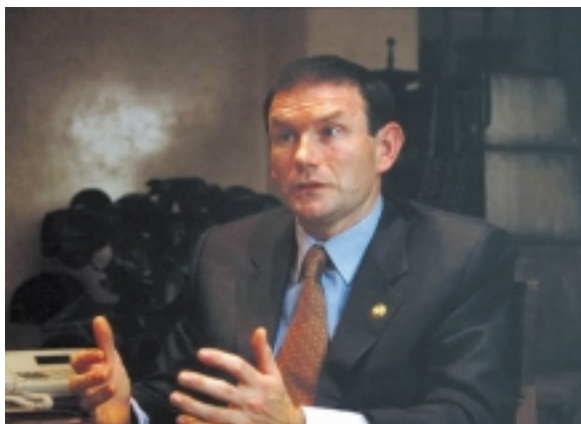
D. Juan José Ibarretxe

Entrevista al Lehendakari de la Comunidad Autónoma de Euskadi, D. Juan José Ibarretxe