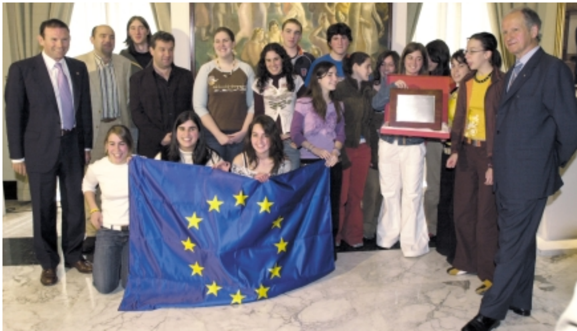
Ibarretxe y Atutxa entregaron los premios Euroscola 2005.

El pasado 9 de mayo tuvo lugar en el Parlamento Vasco la entrega de Premios de la XII Edición del Concurso Euroscola, dirigido a la promoción del proceso de integración europea entre los centros escolares, y que este año lleva por título “Una Constitución para Europa” en Internet .