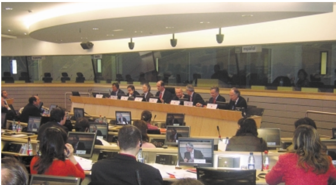
Presentación de la Cumbre en el Comité de las Regiones.

El Comité de las Regiones ha sido testigo del lanzamiento en Bruselas de la II Cumbre Mundial de Ciudades y Autoridades locales sobre la sociedad de la información 1 (Bilbao, del 9 al 11 de Noviembre 2005). El lanzamiento organizado por la Delegación de Euskadi en Bruselas, Eris@ y Cifal- Bilbao, contó con la participación de autoridades locales y regionales europeas, asociaciones y corporaciones del sector, así como miembros de organismos e instituciones comunitarias. La representación de los organizadores de la II Cumbre Mundial (Gobierno Vasco y UNITAR), y sus distintas entidades colaboradoras (Fondo de Solidaridad Digital, Erisa, Comisión Europea), así como el Secretario Gral. del CdR, desgranaron ante el público asistente la misión, objetivos y actores de la Cumbre a celebrarse en Bilbao.