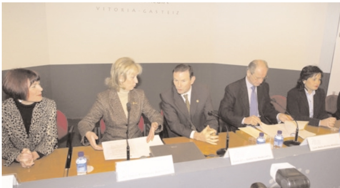
El Lehendakari Juan José Ibarretxe inaugurando la conferencia.

Durante los pasados 21 y 22 de febrero se celebró en el Palacio Villasuso de Vitoria-Gasteiz la conferencia internacional titulada “La inmigración en la Unión Europea: un análisis multinivel”.