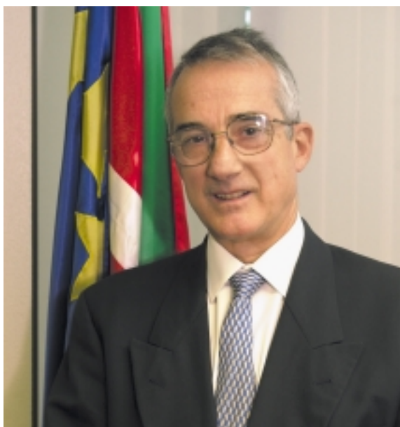
José M a Muñoa

El Comisionado del Lehendakari para las Relaciones Exteriores indica que “Europa se construye basándose en una solidaridad interna europea y abierta al mundo entero”.