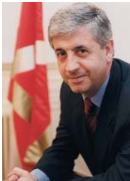
Karmelo Sáenz de la Maza

K armelo Sáenz de la Maza, Presidente de Eudel, en su entrevista afirma que "los líderes europeos han comenzado a ser conscientes de que en un entorno de progresiva globalización la respuesta a las demandas y aspiraciones de los ciudadanos están vinculadas, hoy más que nunca, a lo local."