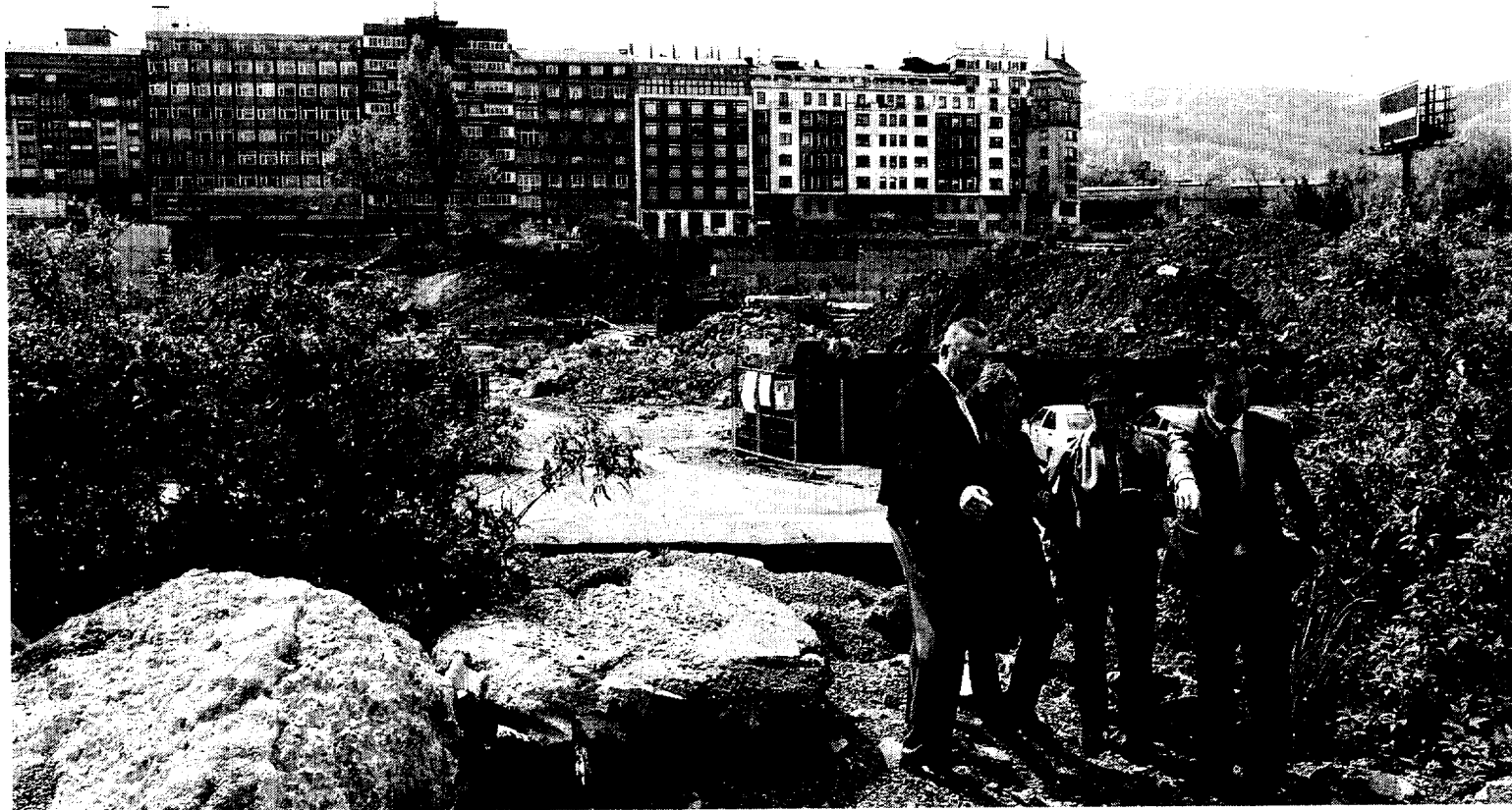
PRESENTE. Responsables de la Universidad de Deusto posan delante del solar en el que se levantará la biblioteca.

El semisótano albergará «los lugares de encuentro» como la cafetería o la sala multifuncional, en la que se podrán organizar desde exposiciones hasta cursos de formación o conferencias. Las salas de lectura ocuparán parte de las cuatro plantas sobre rasante y estarán orientadas hacia el Guggenheim. El arquitecto ha aprovechado la extraordinaria altura de los techos -6 metros- para construir un altillo a mitad de pared en los laterales que bordean de la sala. De esta forma, consigue duplicar el espacio destinado a los despachos de trabajo y colecciones de libre acceso, sin perder luminosidad.