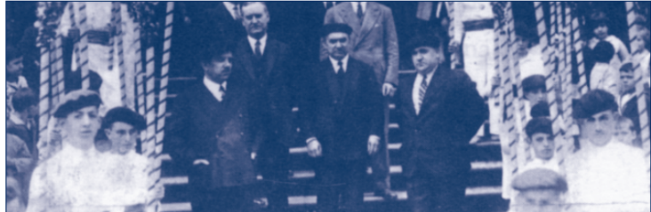
GURE MENDEA liburuk

Euskararen Eguna ospatu zen abenduaren 3an, hala Euskal Herrian nola diasporako zenbait herritan ere. Berez, lehenengo Euskararen Eguna 1949ko abenduaren 3an egin zen. Orduan, espainiar estatuko egoera politikoa tarteko, Euskararen Egunaren ekitaldiak Iparraldean eta Amerikako hainbat lekutan burutu ziren. Jatorrian, ospakizun hau Eusko Ikaskuntzaren sorrerari estu loturik dago.