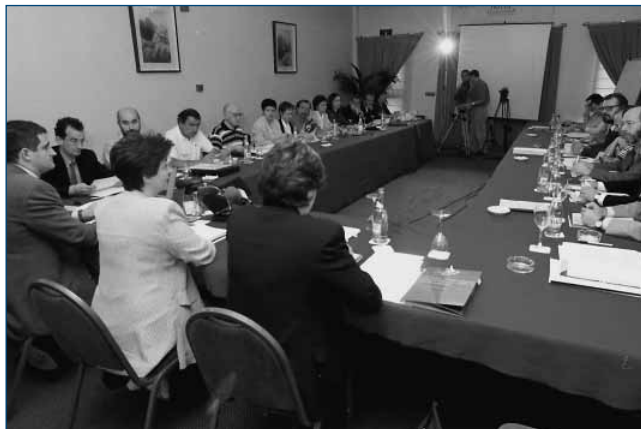
Euskararen Aholku Batzordeak aho batez onartu zuen Euskara Biziberritzeko Plan Nagusia

Plana osatzeko zutabe nagusiak elkarrizketa eta adostasuna izan dira. Euskararen Aholku Batzordean luze-zabala eztabaidatu eta landu da, gure gizartearen diren bateko zein besteko iritziak jasotzearen. Finean, erakundeen, elkarten eta herritarren auzolanean oinarritu da. Horixe baita, funtsean, plan estrategiko baten giltza: euskararen zabalkundearen eta erabilera zerikusirik eta zeresanik izan dezaketen erakundeen, elkarten, taldeen eta norbanakoen indarrak egituratu, batu eta ahal den etekinik handiena ateratzea gure herria benetan elebidun izan dadin.