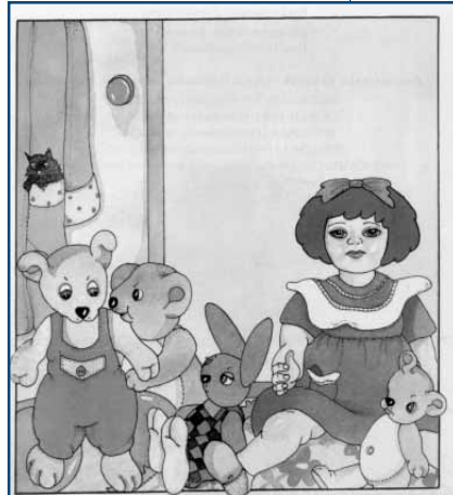
SANTISTEBAN, K. (1991). Jostailuen aitzamendua. Elkar.