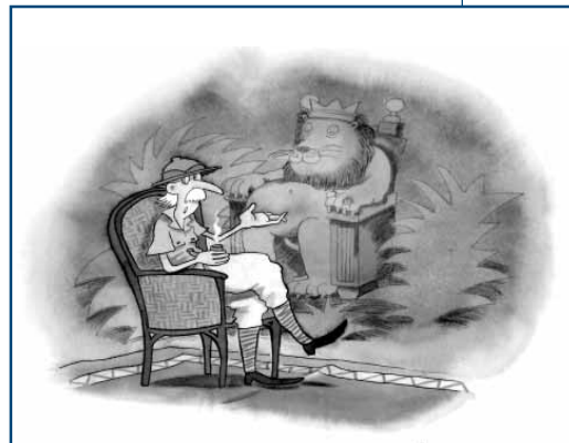
24 ilustratzaileen 48 marrazki agertzen dira Xabier Etxanizen liburuan.