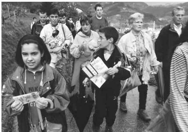
✕ Eskolaz kanpoko ekintzen artean aisialdiko ekintzak eta kirola dira arlorik nagusienak

Eskolaz kanpoko ekintzak, oro har, udalak, ikastetxeek edota elkarteek antolatutakoak izan ohi dira, nahiz eta bakoitzak maiz bere bidetik jotzen duen. Euskararen jarraipenerako programetan txertatzeko ekintzen antolaketan, beraz, ezinbestekoa da udalerrian arlo honetan la-