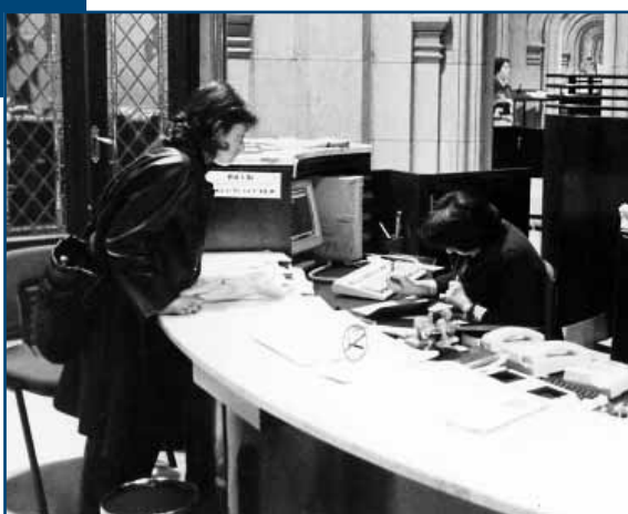
✕ Administrazioan geroz eta gehiago dira euskaraz lan-tresna dutenak.

Komunikazio zirkuluen bidez, erakundeko kide guztien planarekiko jarrera eraginkorra lortu nahi da. Horretatik, oso garrantzitsua da, besteak beste, kide guztiei, agintari zein langileei, helaraztea planari zein hizkuntza normalizazioari buruzko informazioa, euren asmoak eta indarrak norantz zuzenduta doazen argi izan dezaten eta, une oro, urrats guztien berri izan dezaten. Era berean, erakundearen kide guztien arteko komunikazioa bideratzen laguntzea izango da zirkuluen beste zereginetako bat.