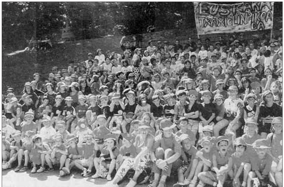
Txatxilipurdi taldeak zortzi urte daramatza lanean Arrasateko haurrekin. Bederatzi langilerekin eta 70 begiralarerekin, urtean zehar 2.000 haur eta gazte bereganatzen ditu. Haur eta gaztetxoentzako aisialdiarekin zerikusirik duten zerbitzuak saltzen dizkie inguruko udal, eskola eta elkaratei.

Aisialdiko talde hauek herritar guztien onespina irabazten ari dira, gizarrean behar dituen zerbitzuak eskaintzeaz batera, egiten duten lana beharrezkotzat hartzen delako Euskal Herriko gizarrearen integrazioarako.