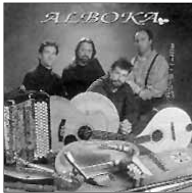
Alboka. Musika instrumentalaren bidetik abiatu da Alboka bere lehen diskoan, oinarrian kantutegi tradizionalako abestiak eta doinuak dituela.

Ia denetan, nabarmen dira kanpotik iritsitako musikaren oihartzunak. Salbuespen bakarra Mikel Laboa izan liteke, honek bereari eutsi baitio behin eta berriro, estilo erabat pertsonala sortuz.