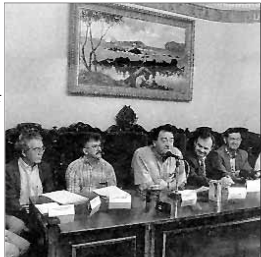
Agintariak UEMA egunean, Bermeon

Liburuaren 3.000 ale egin dira eta salgai daude liburutegietan. Eusko Jaurlaritzak eta Nafarroako Gobernuak, bestalde, liburuaren laburpena egiten duen doaneko foiletoa atera dute.