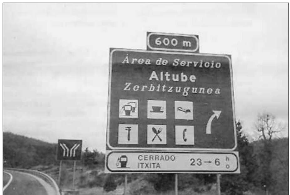
Hego Euskal Herrian nabarmenagoa da euskararen agerizko erabilera

Euskaldunak ezezik, Euskal Herria pasadan zeharkatzen duen bidaiaria ere berehala ohartuko da euskararen herrian zehar doala.