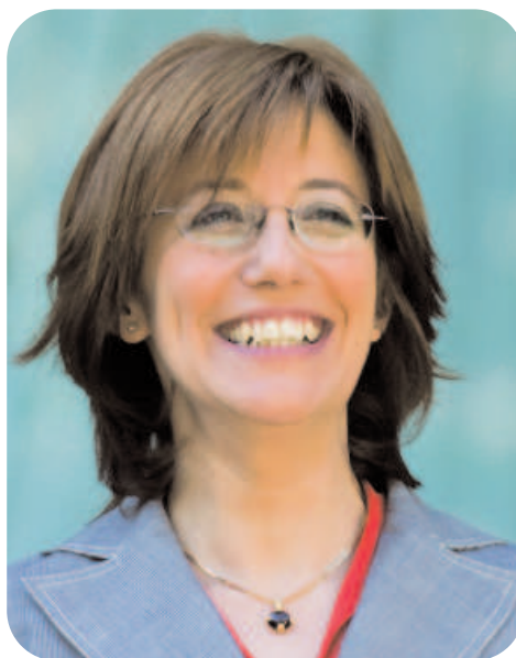
Blanca Urgell Eusko Jaurlaritzako Kultura sailburua.

Euskal gizartearen errealitate elebiduna ez da simetrikoa, eta simetriarik ezak tratamendu egokia behar du politika, administrazio eta lege ikuspegitik. Hiztun bakoitzarengan bi hizkuntzek ez dute toki berbera okupatzen eta ez dituzte eginkizun berberak betetzen; ez eta gizatalde, erakunde edo lurralde desberdinetan