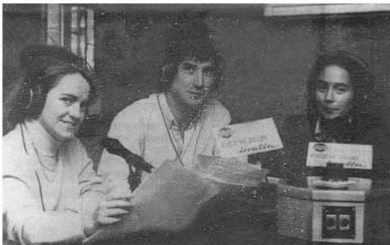
Kazetaritzan trebatutako esatari gazteak ditu Bizkaia Irratiak

Programazioa goizeko 7etatik gaueko 11k arte luzatzen da eta denetarik eskaintzen du: irrati klasikotik hasi eta formula irratiraino, tartean lehiaketak eta sartuz. Orduero albistegi laburtxoak eskaintzen ditu.