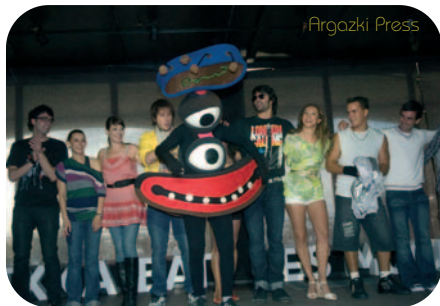
Ukan abestiaren aurkezpena.

HPSk udako txanpari heldu dio. Ukan Records-en eskutik, Ukan abestia eta bideoklipa aurkeztu ditu, herritar guztiak, euskaraz gutxi edo asko jakin, euskarara erakarri nahian. "Pixka bat es mucho" lelopean, euskararen erabilera sustatzea helburu duen abestia kalean da jada. Izan ere, herritarren esku dago euskaraz egitea, ez dakitenek zertxobait ikasiz eta dakitenek erabiliz.