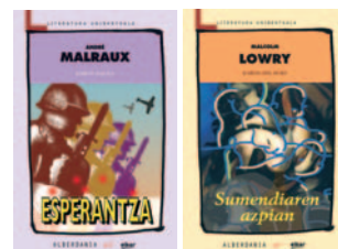
Esperantza eta Sumendiaren azpian.