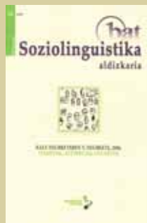
Kale neurketaren V. neurketa, 2006. Emaitzak, azterketak, gogoetak Bat Soziolinguistika aldizkaria