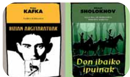
Bizian argitaratuak eta Don Ibaiko ipuinak .