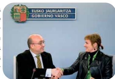
HPSko eta Topaguneko ordezkariak hitzarmena sinatzeko ekitaldian.