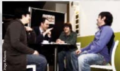
Lea-Artibaliko Berbalaguna egitasmoa arduradunak euskaldun zahar eta euskaldun berri batekin

Bai, eta esango dut zergatik. Erakunde arteko elkarlana aspaldikoa da mintzapraktika egitasmoen inguruan. Alegia, horrelako egitasmoak martxan dauden herri eta eskualdeetan ohikoa da euskara elkarte, euskaltegi eta herriko bestelako zenbait erakunderen arteko elkarlana. Azken urteotan, herrian herriko ekimenez gain, herri artekoak ere sortu dira. Sendotu ere bai, zenbait. Esate baterako, azken urteotan sortutako zenbait ekimen: Berbarri hitzarmena, Mintzaeguna (bi urtez antolatu dena), herri ezberdinetako 2005ean antolatutako jardunaldiak eta beste zenbait.