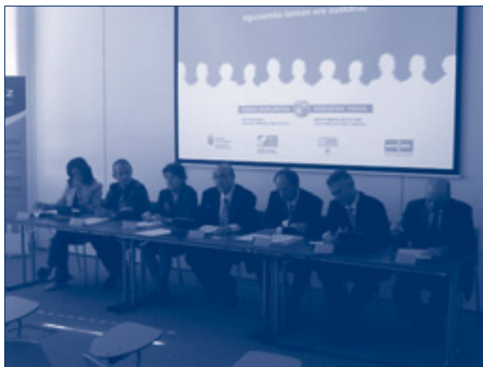
LanHitz ekimen-programaren aurkezpena.

Kontzertazioa eta elkarlana, beraz, ditugu LanHitz programaren abiapuntu.