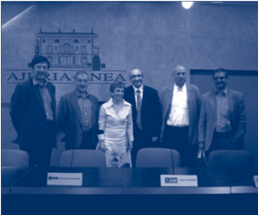
Eusko Jaurlaritzak eta ELA, CCOO, LAB eta UGT sindikatuek ere akordioa sinatu zuten.