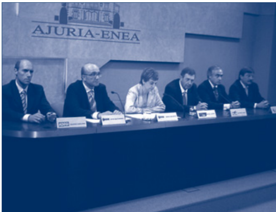
Eusko Jaurlaritzak eta enpresaburuuen elkarteak irailaren 6an izenpetutako hitzarmena.

Erreferentzia Marko hau, jakina, euskara planak dituzten enpresekin zein esparru honetan ari diren aholkulariekin kontrastatuta dago, eta beti egongo da aukera ekarpenak egiteko, markoa hobetze aldera.