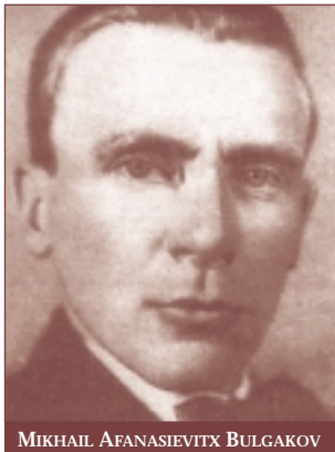
MIKHAIL AFANASIEVITX BULGAKOV