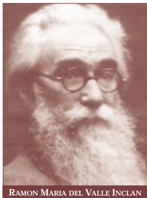
RAMON MARIA DEL VALLE INCLAN