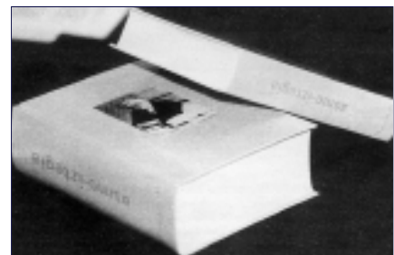
GAZETA MUNICIPAL DE VITORIA - GASTEIZ

Sin duda, este enorme diccionario es el reflejo del trabajo de una generación a la vez que muestra de una época del euskera.