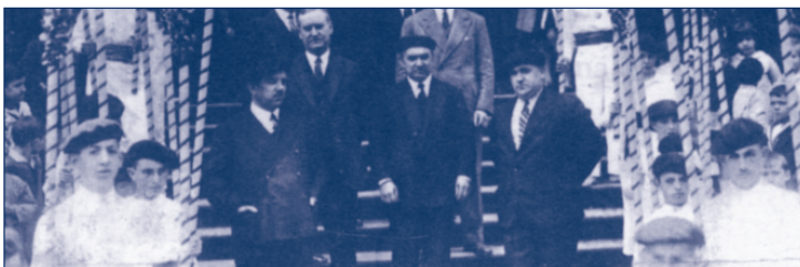
GURE MENDEA Iborraik

El pasado 3 de diciembre se ha celebrado, tanto en Euskal Herria como en el resto de los países de la diáspora vasca, el Día del Euskera. Como tal, el primer Día del Euskera se celebró el 3 de diciembre de 1949. Debido a la situación política en el estado español, los actos conmemorativos tuvieron lugar en Iparralde y en diferentes países del continente americano. En realidad, la celebración está estrechamente relacionada con la trayectoria de Eusko Ikaskuntza, la Sociedad de Estudios Vascos.